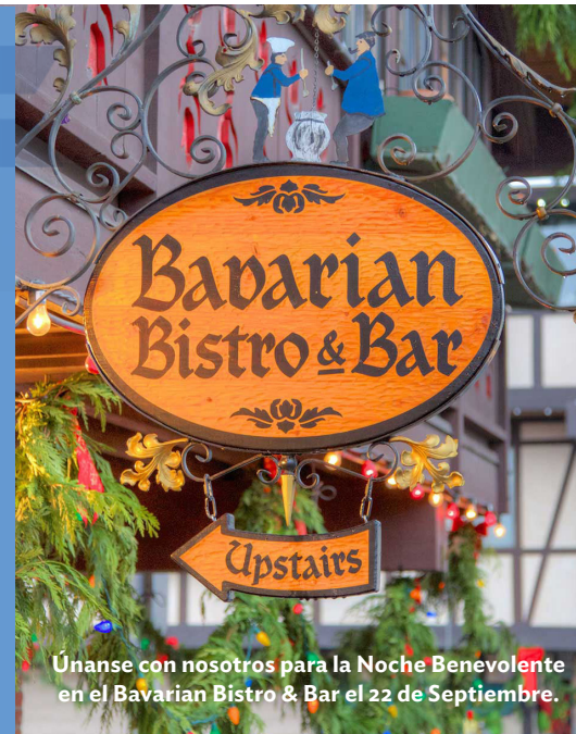
Únase con nosotros para la Noche Benevolente en el Bavarian Bistro & Bar el 22 de Septiembre.

Compartir la Comida es un Regalo: los restaurantes se están recuperando después del año más difícil de la historia. Por lo tanto, es sorprendente que algunos estén de acuerdo en asociarse con nosotros para las Noches Benevolentes! Al celebrar la libertad de cenar con sus amigos y familiares, únense con nosotros para apoyar a estos restaurantes que muestran su profundo compromiso con la comunidad.